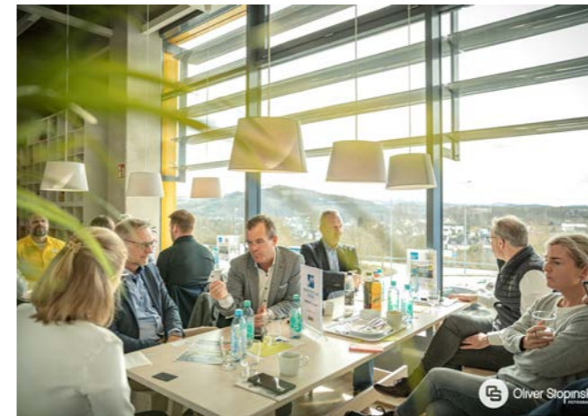
Business Lunch im Food Court Uni Siegen