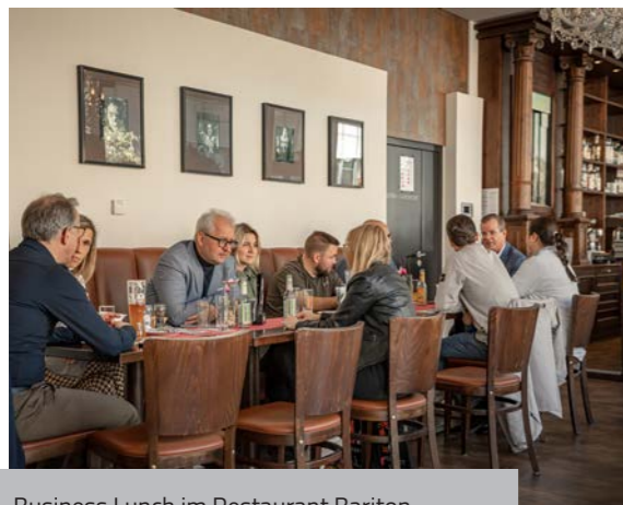
Business Lunch im Restaurant Bariton